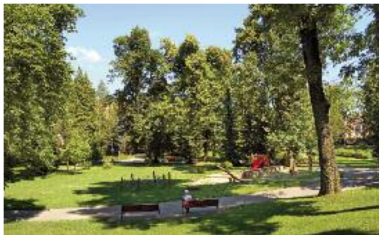
TYRŠOVY SADY V JABLONCI NAD NISOU (4. 8. 2013,)

Jedním z nejhonosnějších městských parků na úpatí Jizerských hor se stal dnešní areál Lidových sadů v Liberci. Původně zde stálo jen sedm domků panské lesní správy (čp. 1275–I existuje dodnes). Oblíbené místo procházek Liberečanů začali postupně využívat někteří podnikaví lidé.