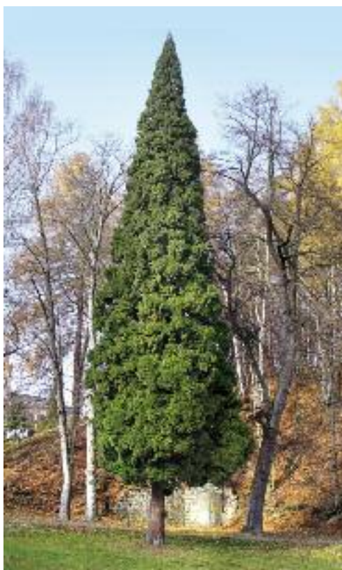
CYPŘÍSEK HRACHONOSNÝ V DESNÉ (2011) Z jehličin v parku u Riedelovy vily zbyl pouze tento stoletý cypřišek.