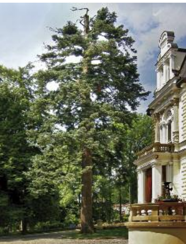
JEDLE U KLINGEROVY VILY (17. 7. 2013, kna) Mohutný exemplář jedle stříbrné s obvodem kmene 370 cm v Novém Městě pod Smrkem.