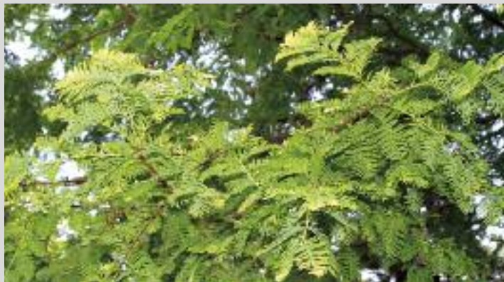
METASEKVOJ ČÍNSKÁ (2012, jbu)