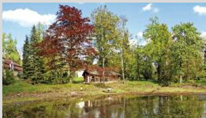
HEJNICKÝ ZÁMEČEK A RYBNÍK V JEHO PARKU (1. 5. 2011,)