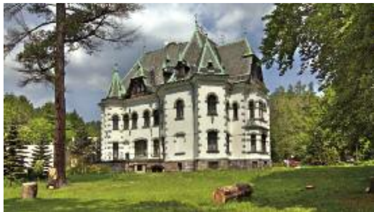
ZBYTEK PARKU U RIEDELOVY VILY V DESNÉ (27. 5. 2008, kna)