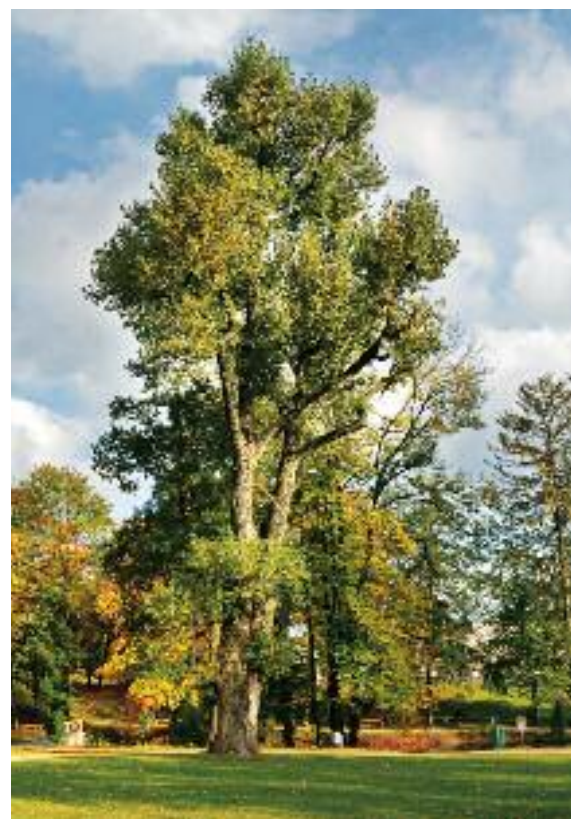
DUB LETNÍ SVAŽČITÝ (13. 10. 2012, rka) Vratislavice nad Nisou se mohou chlubit velmi starým parkem.