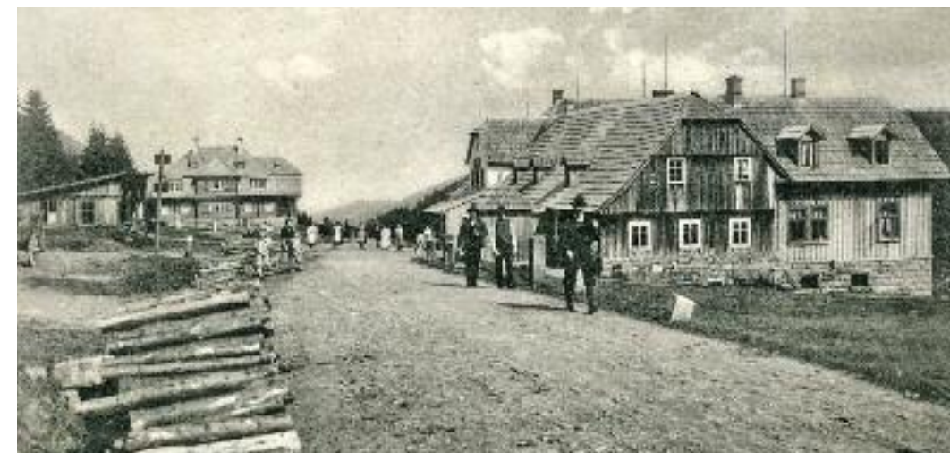
Z boku napojené křídlo chaty ještě svítí novotou. U silnice se nachází mýtní budka, v pozadí lovecký zámeček a vlevo altán. Nepříliš estetický dřevník je už mimo záběr. V této podobě zůstala Smědava až do začátku třicátých let. (výřez ze světlotiskové pohlednice, odesl. 1912, vyd. Ferdinand Stracke, Liberec, sbírka P. Kurtina)