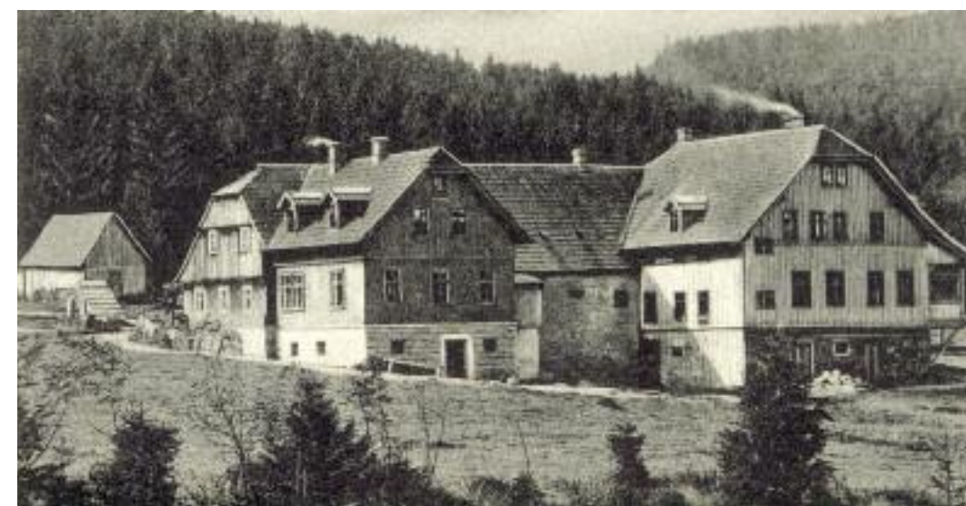
Smědava ze zadu. (1915, výřez ze světlotiskové pohlednice, vyd. F. Wunderlich, Frýdlant, archiv M. Jecha)