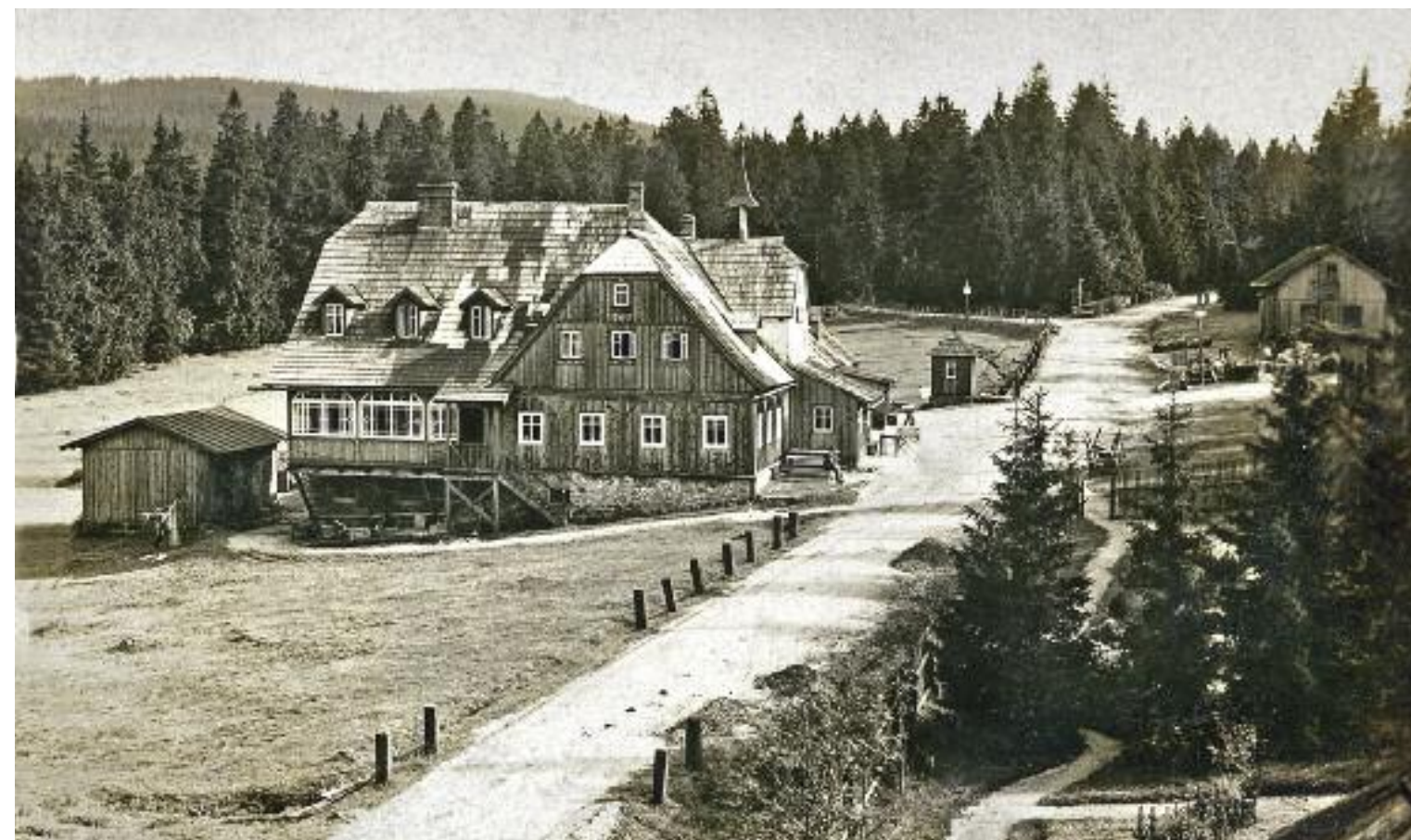
Stará Smědavska chata s okolím ze střechy sousedního loveckého zámečku. (výřez z fotopohlednice, odesl. 1928, sbírka P. Kurtina)

Porovnání císařského otisku stabilního katastru z roku 1843 s doplněným stavem k roku 1871. Vidíme, že za necelých třicet let se téměř nic nezměnilo, pouze k většímu dřevěnému stavení přiléhá červeně označená zděná (nespalitelná) část. (ČÚZK, SOKA Liberec)