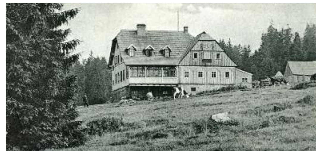
Rozšířená Smědavska chata. (světlotisková pohlednice, odesl. 1908, vyd. Dr. Trenkler, Lipsko, sbírka P. Kurtina)

Komplex původních budov měl dvě čísla popisná: 163 a 318. O prostory se dělilo dva nájemci, část sloužila turistům a část lesnímu personálu a dřevařům. Stanici tu měli i celníci a bydlel zde také hajný.