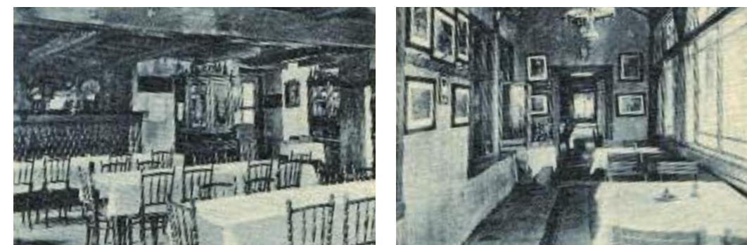
Interiér Smědavske chaty. (20. léta, detaily světlotiskové pohlednice, vyd. Franz Madlé, Liberec)