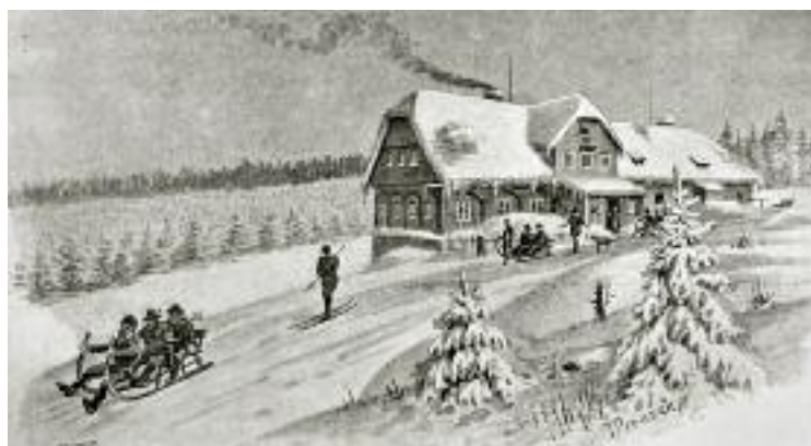
Smědava na kresbě Jana Prouška. (před 1899)

V roce 1841 byla chata přestavěna a rozšířena, ale přesto ji o čtyři roky později popsal E. Straube ve své Cestovní skice, kterou citujeme na jiném místě (→90), jako mizernou prkennou boudu s výčepním právem , v níž se nacházela i služebna c. k. finanční stráže.